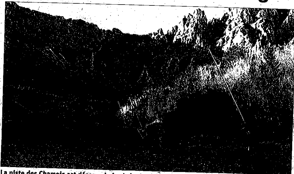
La piste des Chamois est désormais équipée de 9 nouveaux enneigeurs. En tout, la station en dispose de 50, qui assurent l'enneigement de la moitié du domaine skiable.

Un projet d'extension du réseau neige de culture avait été lancé par la précédente municipalité de Gresse-en-Vercors. La nouvelle équipe a souhaité donner la parole aux habitants quant à la poursuite ou l'abandon du projet, en leur posant la question suivante le 9 mai dernier : "Êtes-vous favorables à l'installation de 9 enneigeurs sur la piste des chamois ?", à laquelle ils ont majoritairement répondu "oui".